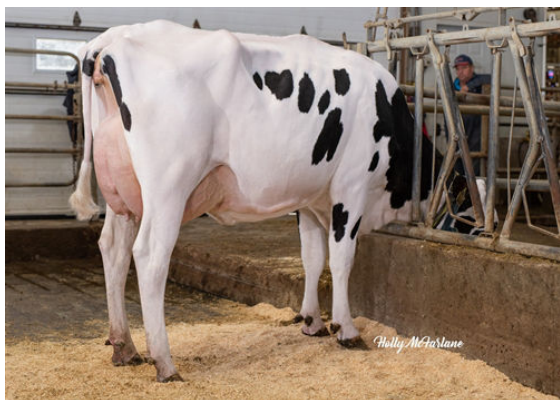
PROGENESIS TOPNOTCH MACIE GRANDDAM